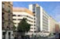
75013 Paris | COALLIA Habitat Restructuration/extension d'une résidence sociale de 182 studios