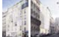
75017 Paris | Coopération et Famille - Groupe Logement Français Résidence de jeunes actifs 2 immeubles - 76 logements et locaux partagés