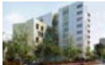
06000 Nice | RSF Résidence hôtelière - 150 studios