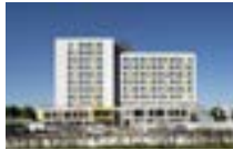
91000 Evry | BIOBIZ 180 logements étudiants sur socle actif comprenant les es- paces dédiés à l'artisanat et un restaurant inter-entreprise