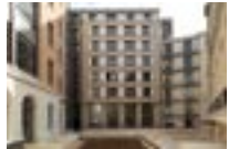
75017 Paris | Immobilière 3F Centre d'Hébergement d'Urgence de 207 lits - neuf et réhabilitation