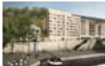
69004 Lyon | ADOMA Résidence sociale de 134 logements, locaux collectifs, bureaux, stationnement en sous-sol.