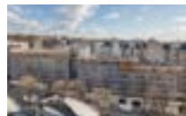
75020 Paris | COALLIA Habitat Restructuration et extension d'un foyer en résidence sociale de 232 logements, construction d'un restaurant associatif