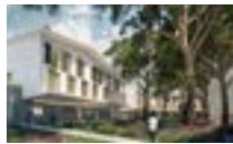
13015 Marseille | RSF UNITE D'HEBERGEMENT D'URGENCE (UHU) de 194 lits pour l'hébergement d'urgence et 30 places sup- plémentaires