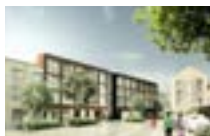
80000 Amiens | COALLIA Complexe social 131 loge- ments