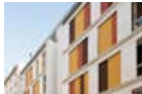
75012 Paris | ADOMA Résidence sociale pour travailleurs immigrés vieillissants - 66 logements individuels et un logement de 5 pièces