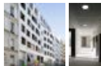
75019 Paris | EMMAÛS HABI- TAT Résidence sociale de 153 stu- dios, Centre culturel, Epicerie sociale