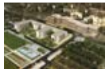
78350 Jouy en Josas | Chambre de commerce et d'industrie de Paris - HEC | Logements étudiants (Construction 1400) et exploitation de résidences étudiantes - campus HEC