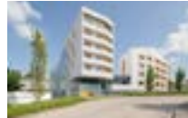
25000 Besançon | GRAND BESANCON HABITAT Espace résidentiel social - 117 logements