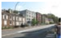
92310 Sèvres | ADOMA Résidence sociale de 147 studios