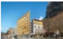
38950 Saint Martin-le-Vinoux | SAFILAF Résidence étudiante de 140 chambres