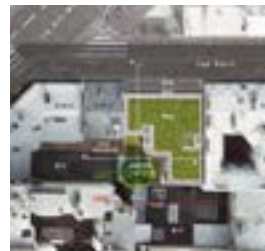
43-45 rue Davy

Démolition d'un foyer et reconstruction d'une résidence de jeunes actifs en deux immeubles distincts, situés aux deux extrémités de la rue Davy - 76 logements et locaux partagés.