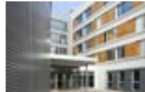
93800 Epinay sur Seine | OSICA Résidence sociale pour jeunes actifs de 220 logements