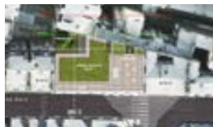
8-10 rue Davy

Plan climat de la ville de Paris - RT 2012 Effinergie + NF Habitat Démarche HQE niveau excellent